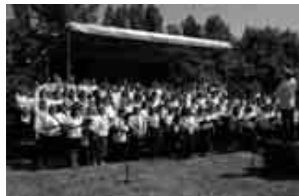
Dunakanyar mesterdalnokai közel háromszázan