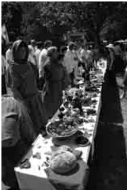
Terült, terült az asztalkánk!