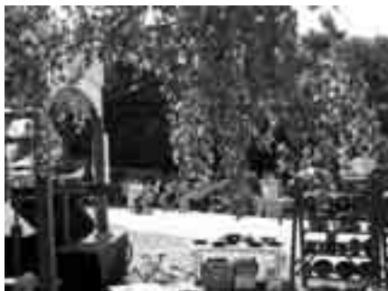
Kézműveseink színvonalas portékáikat kínálják