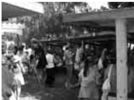
A gyerekek a Benedek Elek Alkotótáborban gyűjtögetik az aranytallérokat