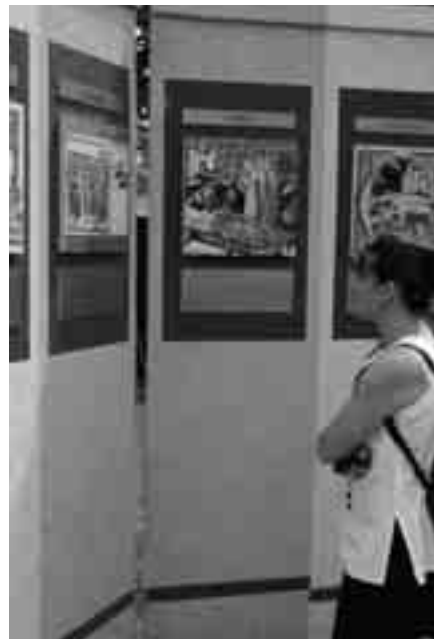
Festett táblaképek mutatják be a települések történetének egy-egy nagy pillanatát