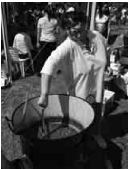
A szakács már tudja, mit főzött