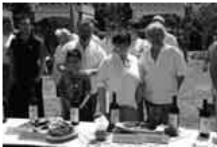
Ime a mű, áfonyás vaddisznó pörkölt