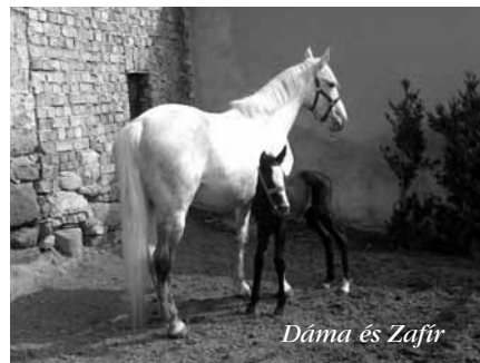
Dáma és Zafir