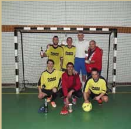
A Dagober Kupa eredményei