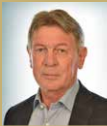
DR. SAJTOS SÁNDOR POLGÁRMESTER

Az Alaptörvény módosítása értelmében a helyi önkormányzati képviselők és polgármesterek általános választását a helyi önkormányzati képviselők és polgármesterek előző általános választását követő ötödik év április, május, június vagy július hónapjában, az európai parlamenti képviselők választásával egyidejűleg kell megtartani. Az új szabályozás alapján először 2024. június 9-én került sor egy napon a két voksolásra. Az Alaptörvény ZÁRÓ ÉS VEGYES RENDELKEZÉSEK 27. pontja értelmében a hivatalban lévő képviselő-testület és polgármester megbízása 2024. szeptember 30-áig tart. Az újonnan megválasztott képviselők és polgármesterek megbízása 2024. október 1-jével kezdődik.