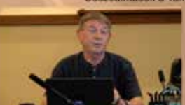
Önkormányzati ülés közvetítése