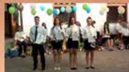
Ballagás a Pollack Mihály Általános Iskola- és AMI-ban