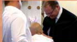
Református istentisztelet közvetítése