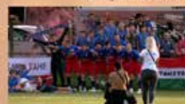
Összeállítások a Tahitótfalu SE futballmérkőzéseiről