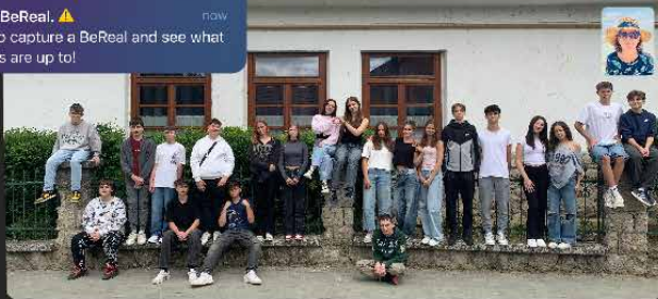
TAHITÓTFALUI POLLACK MIHÁLY ÁLTALÁNOS ISKOLA ÉS AMI 2017-2025 | 8. B