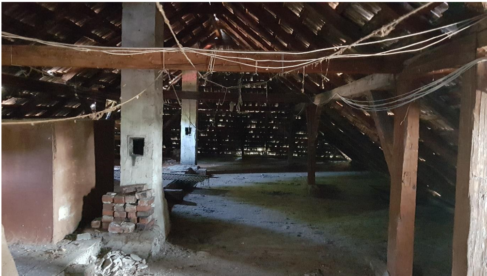
A kép bal oldalán látható a dobozolt fafödém szerkezet