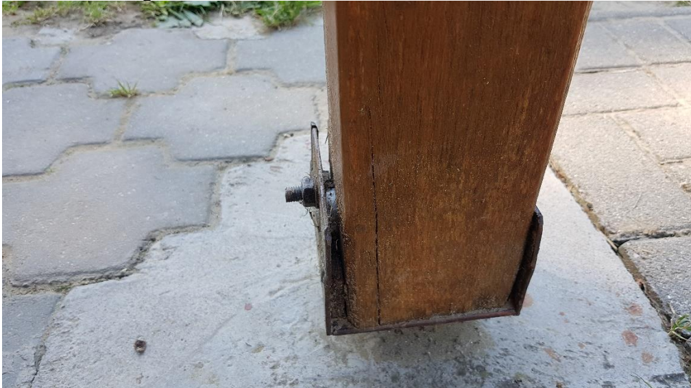
Megszüntetendő balesetveszélyes részlet