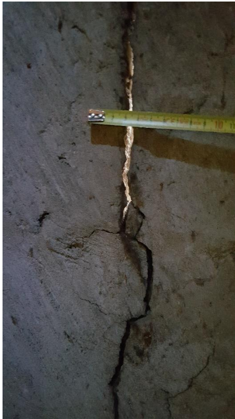
Az utcai épület traktus pengéfalán látható szerkezeti repedés