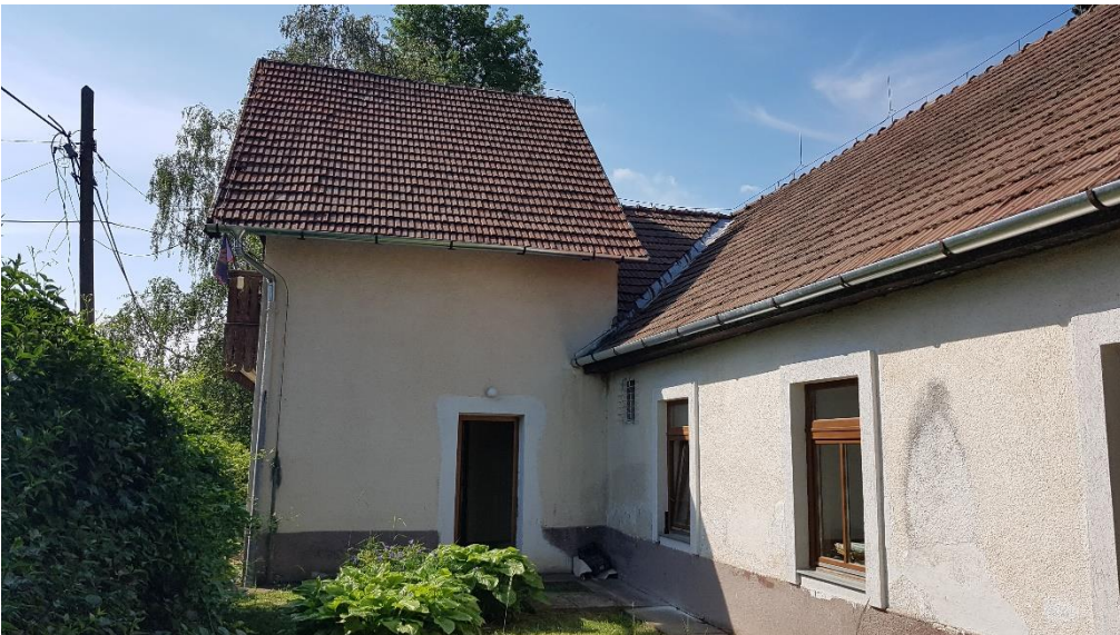
Az utcai épület traktus magastető padlástere nem volt megtekinthető annak zártsága miatt