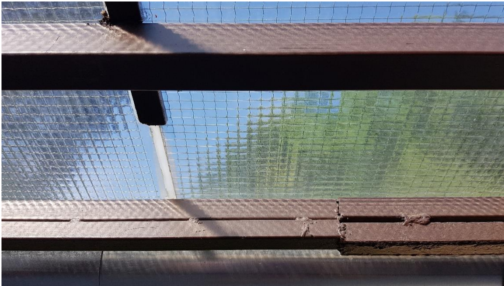
A hátsó kerti előtető „házilag” kivitelezésben készült, cserélendő a tartószerkezettel együtt