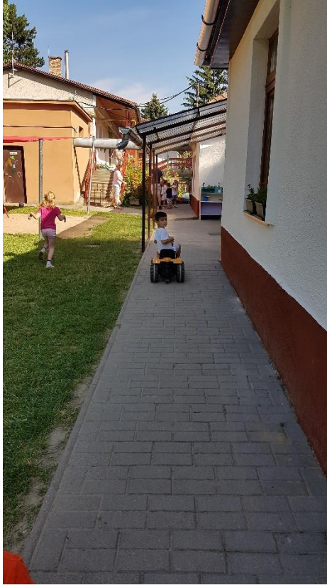
A hátsó kerti homlokzat előterében épült burkolat bontandó, de visszaépíthető, területén létesül a fallal párhuzamos drénvezeték és függőleges kiszellőztető felületszivargó