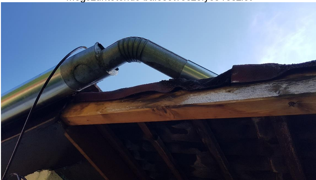
Az előtetők bádogozása részben szakszerűtlen, cserélendő