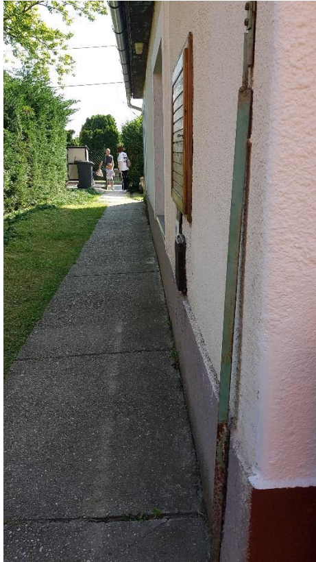
A külvizek károsítják az alapfalakat és a homlokzati falakat, a külső vízvezetés elégtelen