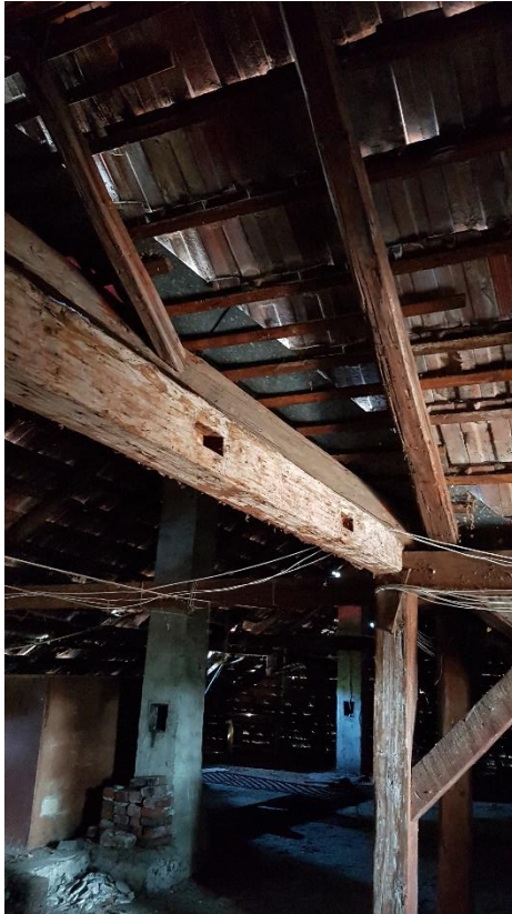
Máshonnan származó, bontott állószerkezet tartók