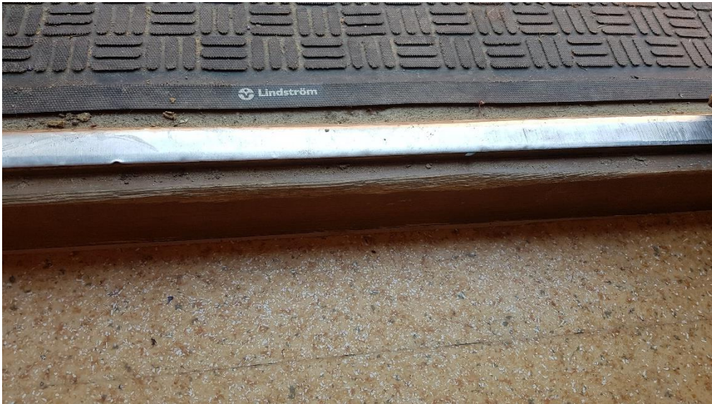
A hátsó kerti homlokzat mellett a külső burkolati sík magasabb, mint a belső padlóvonal. Ez a szivárgóépítést követő burkolat visszaépítésnél korrigálandó