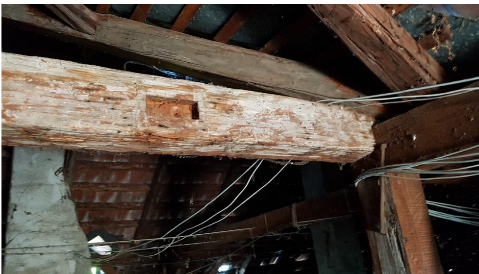
A fa tetőszerkezet négy féle puhafa anyagból áll, többször javították, a képen bontott, utólagosan beépített széktartó látható

(készítette: TÉR-TEAM Kft., készült a 2020.06.23-i bejáráson)