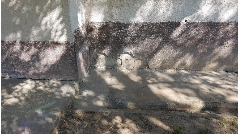
Az elégtelen külső vízvezetés miatt a főfalak feláznak