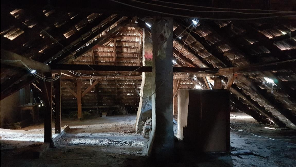
A kétállószerűes fa fedélszék általános képe a visszabontandó kéményekkel