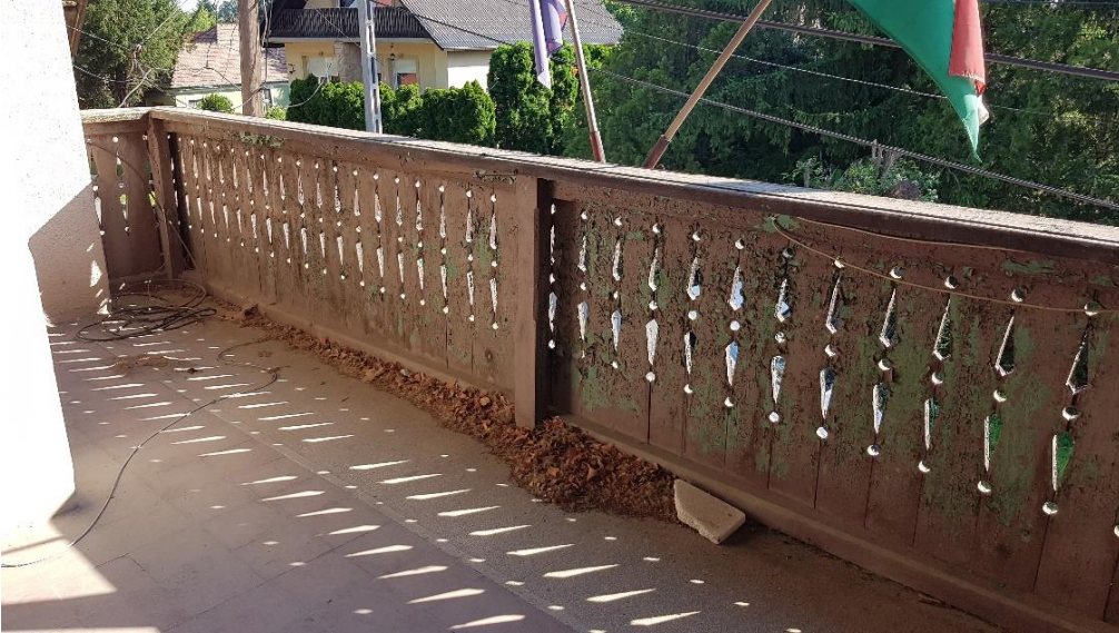
Az utcai ormfal korlát szerkezete megfelelő állékonyságú