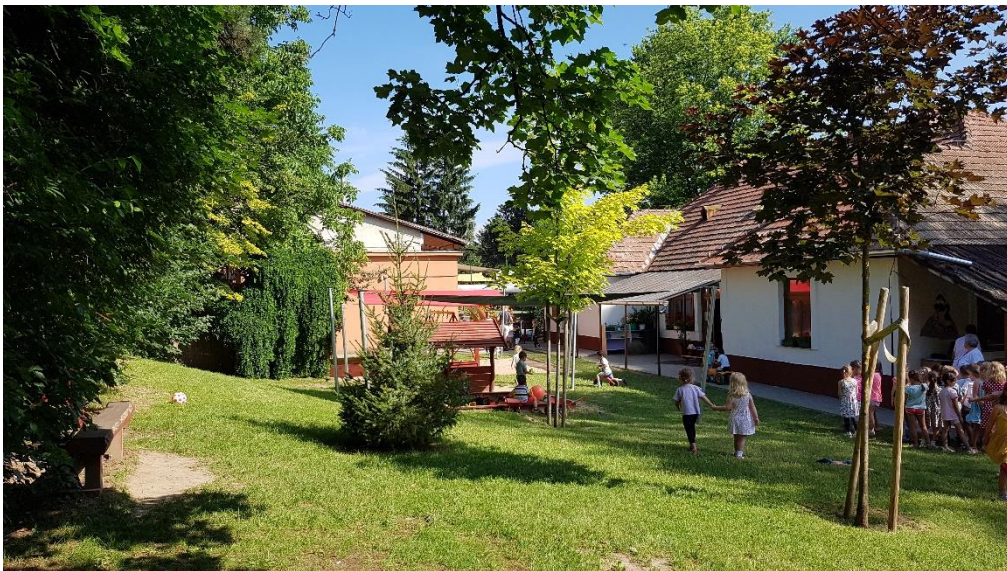
A hátsó kert terepfelšíne lejt az épület felé, amit a felszíni- és a szivargó vizek, valamint az épület tető csapadékvizei egyaránt károsítanak