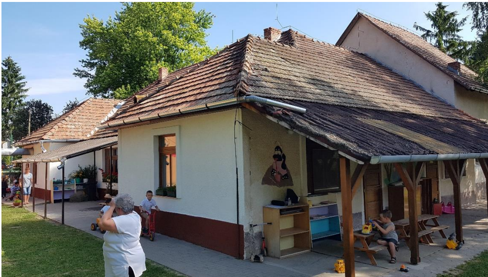
A teljes cserépfedés lécezéssel együtt cserélendő, a jobb oldali előtető faszerkezete megmarad, a bal oldali előtető teljes egészében cserélendő