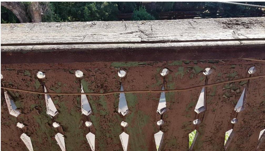
Az utcai oromfal korlátja helyben felújítható